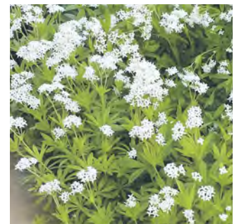
Waldmeister - Galium

weiß auch ich nicht. Aber ich bin zugegebenermaßen fast doppelt so alt wie die meisten HäuslebauerInnen um mich herum - mitten im Neubaugebiet. Ich glaube nämlich, dass Gartensünden aus purer Unwissenheit begangen werden. Und nicht aus böser Absicht. Mein Versuch, meine Ratschläge beim Spaziergang durch das Neubaugebiet ungefragt den Unermüdlichen zuzurufen, scheiterte. Ich war die besserwissende Ökologie von diesem seltsamen Garten an der Ecke mit dem Holzhaus aus Stroh, Holz und Lehm. Das ist vielen