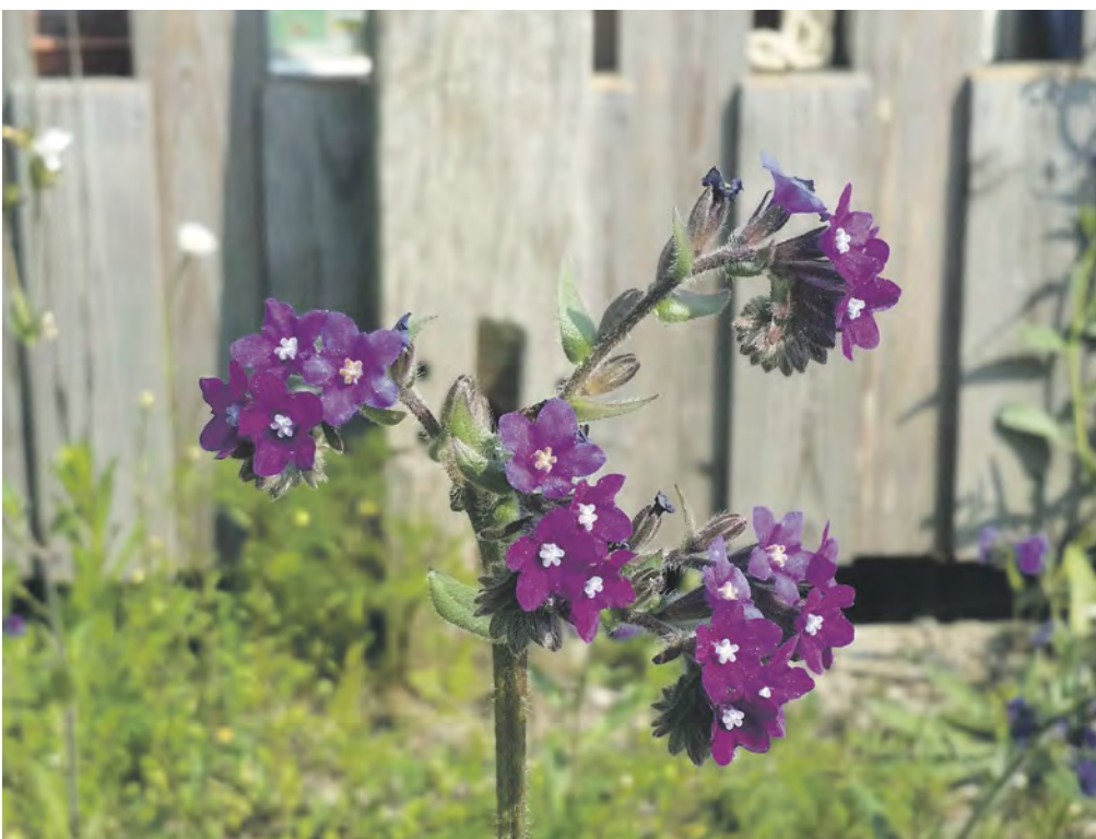
Hundszunge - Cynoglossum