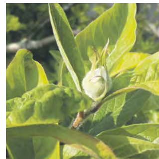
Mispel - Mespilus

In unserem Klima gibt es jedenfalls nicht mal Mikroorganismen, die den Grünschnitt dieser Pflanzen wieder zersetzen könnten - nicht kompostierbar. Er wächst so schnell und ist derart anpassungsfähig, dass er unbedingt fachkundig in Zaum gehalten werden muss. Blüht er wie gerade jetzt- nutzt er nicht mal den hiesigen Insekten, denn sie hatten nicht genug Zeit, sich an den „Frischling“ anzupassen. Abgesehen davon: in Telgte Süd-Ost gibt es eine Gestaltungssatzung, die