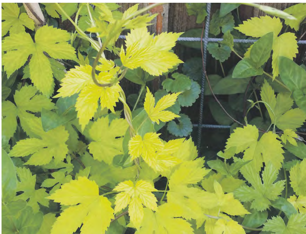
Goldhopfen - Hummulus

Artensterben, Klimakrise und die Verantwortung im