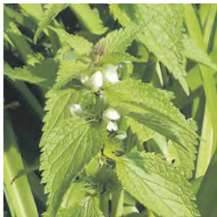
Weißer Taubnessel - Lamium

Erstens blüht es hinreißend schön, schützt eure Fläche vor Hitze und Kälte, sorgt für erhöhte Wasseraufnahme des Bodens und wird Lebensraum für verschiedene Tiere.